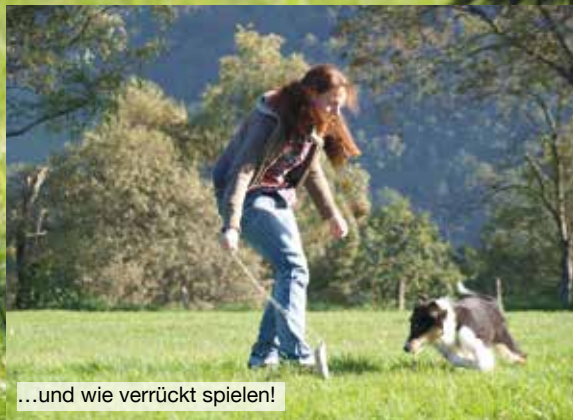
...und wie verrückt spielen!