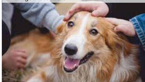
Extrem gestresst durch Kinderhände

Das kann aber nur funktionieren, wenn Kind und Hund in ein solides soziales Umfeld eingebettet sind. Ruhe, Konsequenz, Geduld und nicht zuletzt Zeit- und Geldinvestition der Erwachsenen sind gefragt. Wer das nicht bieten kann, sollte mit der Hundanschaffung lieber noch warten, denn eine Abgabe des Tieres, weil man merkt, dass man der Aufgabe nicht gewachsen ist, reißt auf beiden Seiten tiefe Wunden – beim Hund, aber auch bei den Kindern, die ihn so gerne haben wollten.