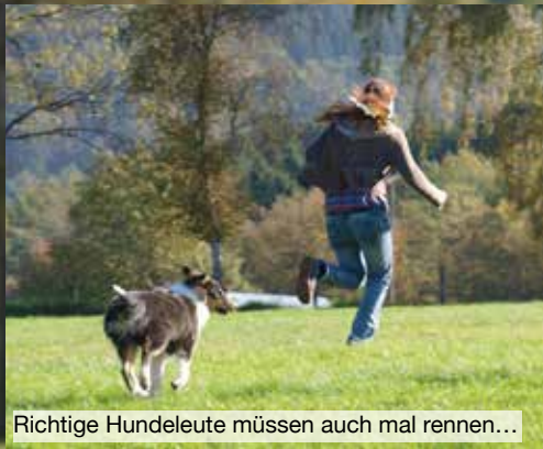
Richtige Hundeleute müssen auch mal rennen...

Eines der ersten Anliegen, wenn ich einen Hund übernehme, ist es, ihm zu zeigen, dass er fortan seine Beißerchen nicht zum Graben darf. Aber in erster Linie geht es um den Bewegungs- und Erkundungsdrang zu befriedigen. Und das geht am besten durch Spielen!