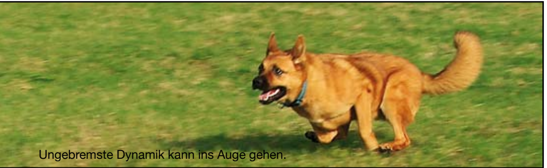
Ungebremste Dynamik kann ins Auge gehen.

D er systematische Aufbau von Tabuisierung und Bestätigung lohnt