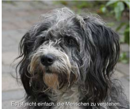
Es ist nicht einfach, die Menschen zu verstehen.

Jeder Welpen macht mal Unfug – sonst wäre er kein normaler Welpen. Das Balgen, Zwickeln und Anspringen, das er bisher an seinen Wurfgeschwistern nach Herzenslust testen durfte, versucht er auf seine neuen zweibeinigen Familienmitglieder zu übertragen. Dabei wird er oft durch unklare Abwehrreaktionen seitens des Menschen unabsichtlich zum Weitermachen angefeuert. Schimpfen, mit